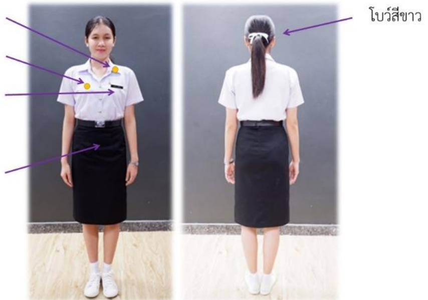
ภาพที่ ๑ ชุดนักศึกษาหญิง (สำหรับนักศึกษาชั้นปีที่ ๑)