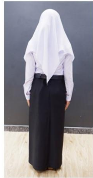
ภาพที่ ๒ ชุดนักศึกษาหญิงแบบมีผ้าคลุมศีรษะ (สำหรับนักศึกษาชั้นปีที่ ๑)